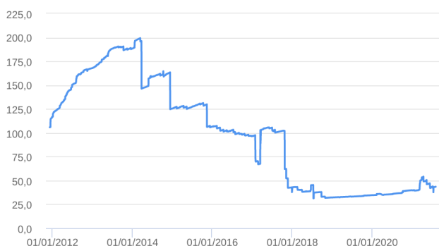
Patrimônio Líquido (R$ Milhões) - 07/12/2011 a 04/08/2021 (diária)